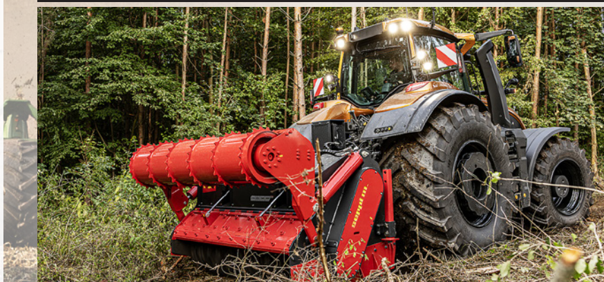
Seria S jest dostępna z systemem napędu na tył TwinTrac, a funkcja Power Boost zapewnia pełną moc WOM, także u największych modeli.

układ napędowy nawet przy niskich prędkościach obrotowych silnika, co pozwala obniżyć zużycie paliwa i koszty eksploatacji tak dużego ciągnika” – mówi Aijasahto.