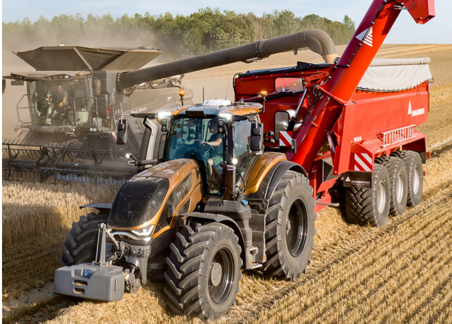
Nowy styl 6. generacji widać szczególnie w konstrukcji pokrywy silnika.

Dzięki nowej kabinie widoczność i komfort zostały jeszcze bardziej udoskonalone. Całkowicie nowe reflektory zostały zintegrowane z nową pokrywą silnika. Kabina posiada również doskonałe oświetlenie robocze, górne reflektory i oświetlenie pasa.