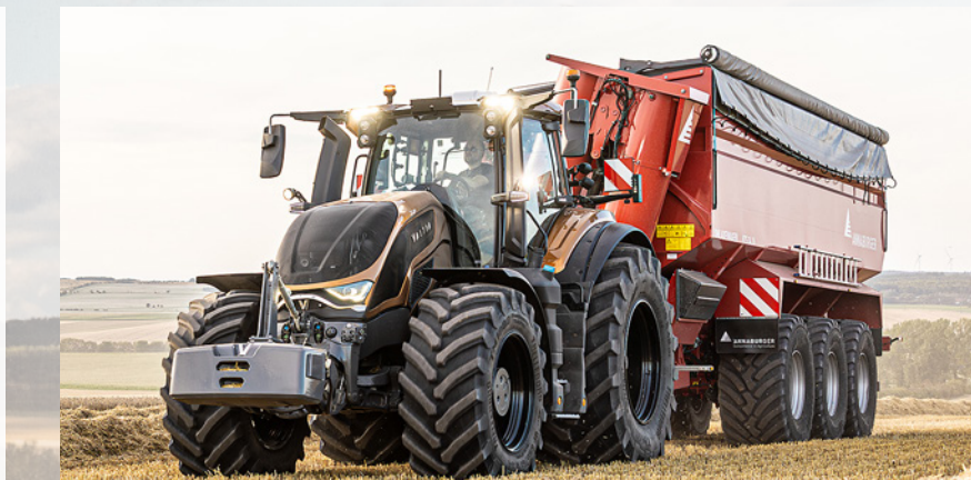
Nowa seria S została zaprezentowana w kolorze metalicznego brązu.

„Silnik bazuje na niezawodnym AGCO Power 8.4 I, przy czym cały układ dolotowy został przeprojektowany, aby umożliwić pominięcie recykulacji spalin przy jednoczesnym nieznanym zwiększeniu zarówno mocy, jak i momentu obrotowego. Silnik ten jest tak zwaną jednostką niskoobrotową, co oznacza, że maszyna uzyskuje wysoki moment obrotowy i moc przez